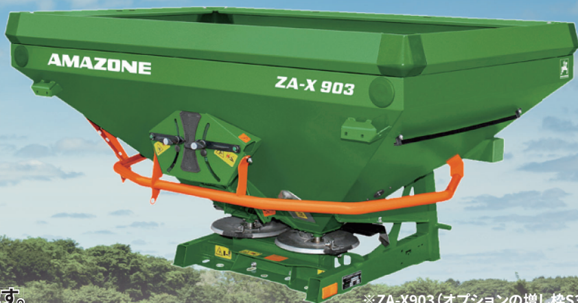
※ZA-X903 (オプションの増し枠S353付)

アマゾーネZA-Xは 老舗の肥料散布機メーカーとして 蓄積されたノウハウにより開発された ツインディスク式ブロードキャスター です。 精度の高い散布性能は環境汚染を少なくし ムラの無い散布により経済的にも優れています。 低コスト農業を目指すプロ農家にぜひお勧めします。