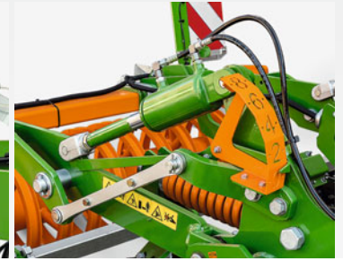
目盛りゲージ付き油圧深さ調整