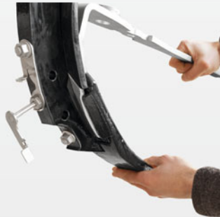
C-Mixクリップシエアシステム