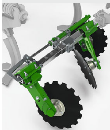
サイドディスクの油圧式調整： （オプション）