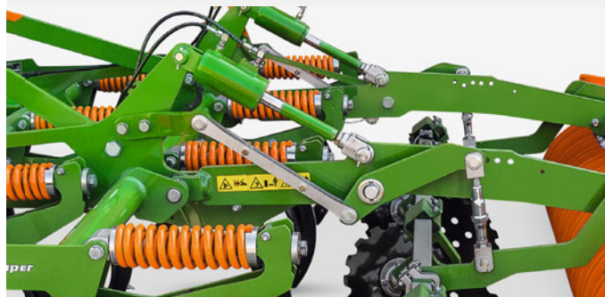
自動式レベリング調整（オプション） 作業深さ調整と連動