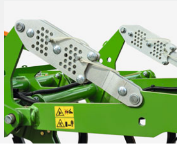
機械式作業深さ調整