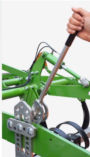
機械式レベリング調整 ピン位置で決定