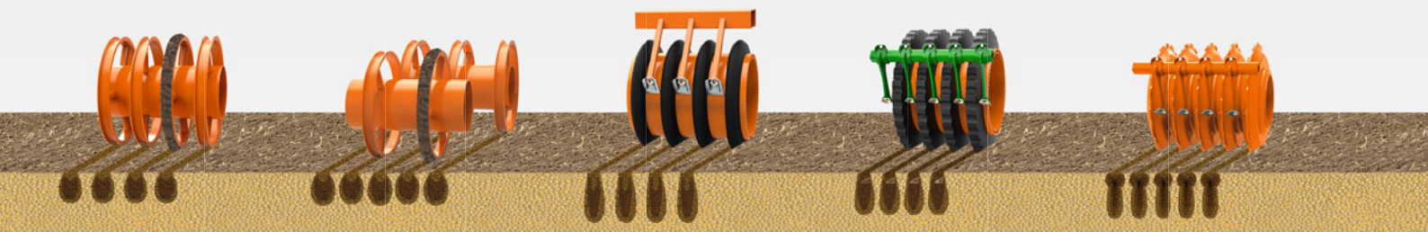
DW ディスクローラー 600 mm