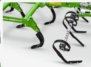
スプリングタインレベラー 調整が簡単