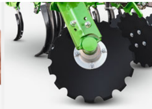
ディスクレベラー 特に自走効果に優れる