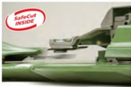
ディスクが 浮き上がった状態

イージーカットのカッティングディスクにはクローネ独自の技術、セーフカットが採用されています。