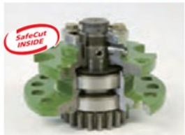
ロールピンが せん断された状態