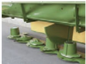
オイルバス方式と 高耐久ベアリングにより 長い耐用年数